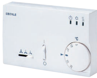
KLR-E 525 52 4p